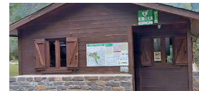
Pradera de Pineta. Inicio pista de La Larri