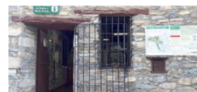
C/ Única, s/n. 22362. Escuaín. Tel. 974 94 15 60

Abierto todos los días en horario ininterrumpido de 9:00 a 18:00 h.