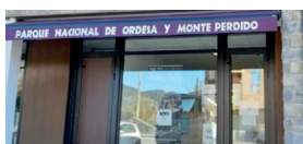
Avda. Pineta. Ed. Portal de Añisclo, 9. 22363. Escalona. Tel. 974 50 51 31

Abierto viernes, sábados y domingos (V a D) de 9:00 a 14:00 y de 15:15 a 18:00 h.