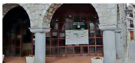
Plaza Mayor, 7. 22350. Bielsa. Tel. 974 50 10 43

Abierto todos los días en horario ininterrumpido de 9:00 a 15:30 h.