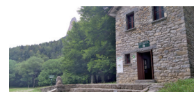
Pradera de Ordesa