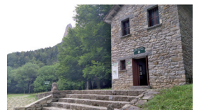
Pradera de Ordesa