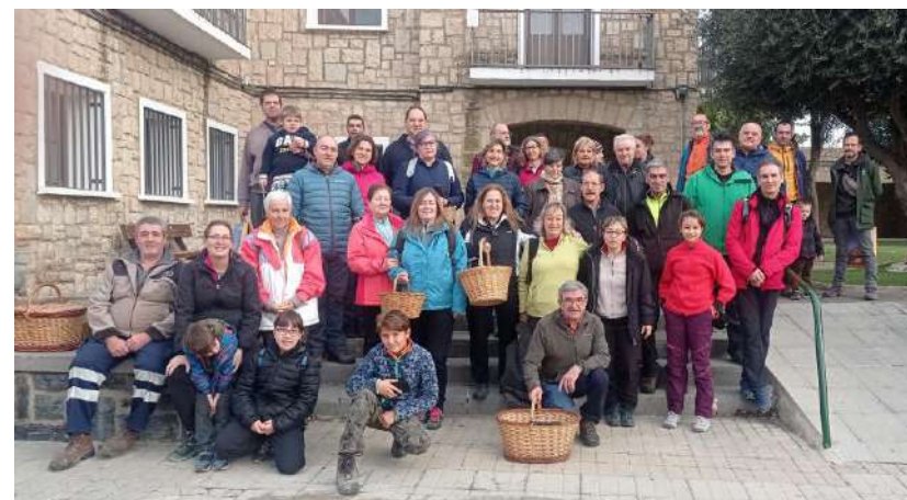
Fotografía: Participantes Jornadas 2022

SAN JUAN DEL FLUMEN 24-25-26 DE NOVIEMBRE DEL 2023