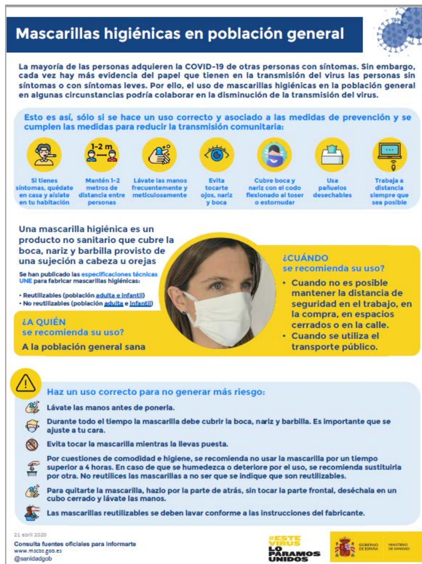
Mascarillas higiénicas en población general (Ministerio de Sanidad, 2020)

Nota: las mascarillas quirúrgicas y las mascarillas higiénicas no son consideradas EPI.