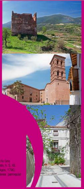
Fotografías: 1. Señalización GR600. 2. Olivar en la vega del río Grío. 3. Castillo de San Valentín, s. XII. 4. Palacio de los Canónigos, 1790, actual ayuntamiento, iglesia parroquial de San Pedro, s. XVI.

INFORMACIÓN. 976 629 101 / www.tobed.es VISITAS GUIADAS TODO EL AÑO. tobedmudejar@gmail.com